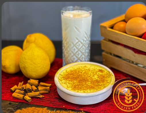
Crema catalana fatta in casa* 3,7

Hausgemachte katalanische Creme Homemade Catalan cream