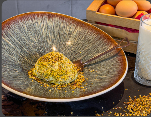
Tartufo di Pizzo calabro IGP al pistacchio o nocciola* 3,7,8

Pizzo Trüffel im Pistazien oder Haselnuss Geschmack Pistachio or hazelnut ice cream truffle of Pizzo