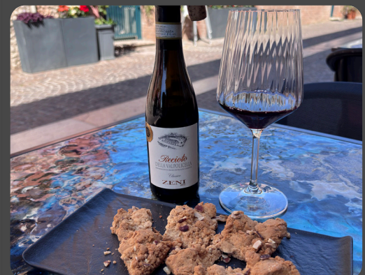
Torta sbrisolona con calice di Recioto Zeni 1,3,7,8

Sbrisolona-Kuchen mit einem Glas Recioto Sbrisolona cake with a glass of Recioto wine