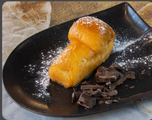
Babà napoletano al rum* 1,3,6

Cassata (sizilianischer Ricotta-Kuchen mit Biskuit, Marzipan und kandierten Früchten) Cassata (Sicilian ricotta sponge cake with marzipan and candied fruit)