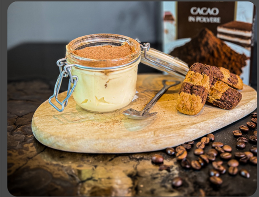
Tiramisù fatto in casa "Il più buono del mondo" 1,3,6,7,8

Pizzo Trüffel im Schokolade Geschmack Chocolate ice cream truffle of Pizzo