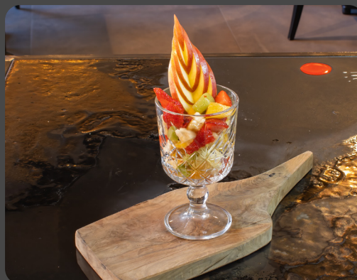
Coppa di frutta

Hausgemachte katalanische Creme Homemade Catalan cream