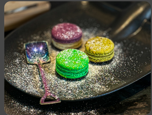
Tris di macarons* 3,7,8

Neapolitanischer Rum-Baba Neapolitan rum baba