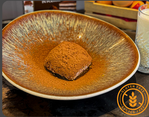
Tartufo di Pizzo calabro IGP al cioccolato* 3,7,8

Pizzo Trüffel im Pistazien oder Haselnuss Geschmack Pistachio or hazelnut ice cream truffle of Pizzo