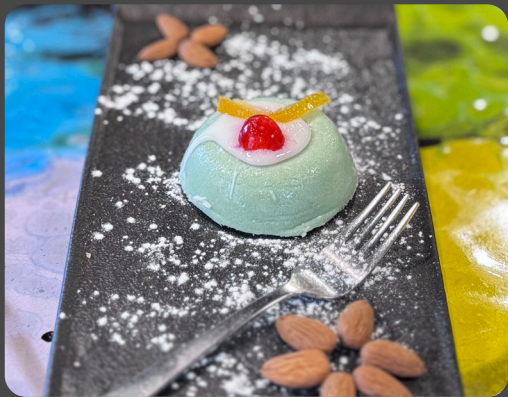
Cassata siciliana* 1,3,7,8

Hausgemachtes Tiramisu "Das Beste der Welt" Homemade Tiramisu "The best in the world"